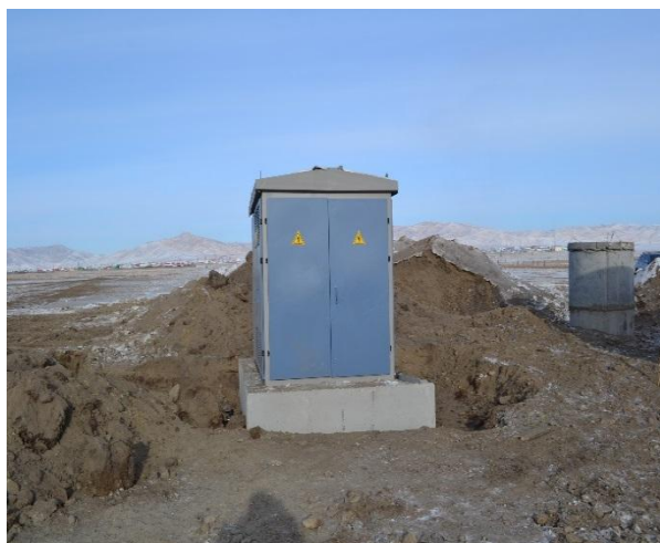
/Цагааннуур сумын төвийн шинэчлэл төслийн ажил/