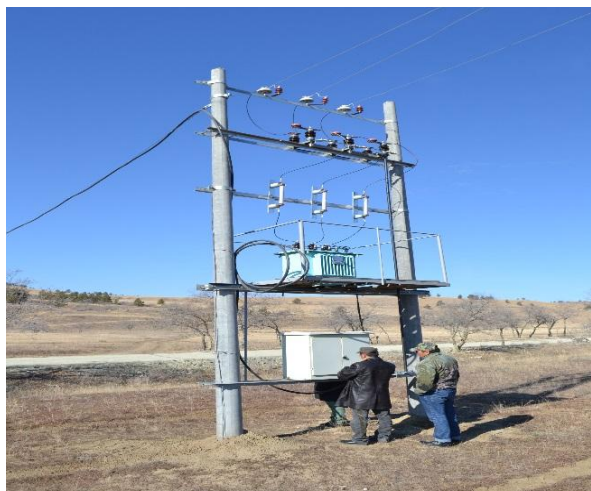
/Сумдын 0,4 кв-ын цахилгааны шинэчлэлт/

Аймгийн ГХБХБГ нь МУ-ын ЗГ-ын 2012 оны 151 дүгээр тогтоолоор батлагдсан “Барилгын ажлыг эхлүүлэх, үргэлжлүүлэх, ашиглалтад оруулах дүрэм”-ийн дагуу барилга байгууламжийг ашиглалтад оруулах комиссын үйл ажиллагааг зохион байгуулсан байна. Улсын төсвийн хөрөнгө оруулалтаар 2014 онд санхүүжүүлсэн төсөл, арга хэмжээг улсын комиссын актаар байнгын ашиглалтад хүлээн авсан байдлыг дараах хүснэгтээр харуулая.